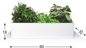
Alésia P.20 cm

POUR PLANS DE TRAVAIL OU TOPS D'ARMOIRES