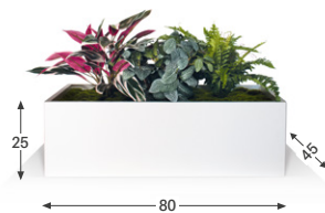
Capri P.45 cm