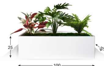
Nissa P.45 cm